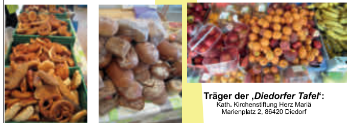
Träger der ‚Diedorfer Tafel‘: Kath. Kirchenstiftung Herz Mariä Marienplatz 2, 86420 Diedorf

Mit der ‚Diedorfer Tafel‘ erreichen wir wöchentlich rund 200 Personen.