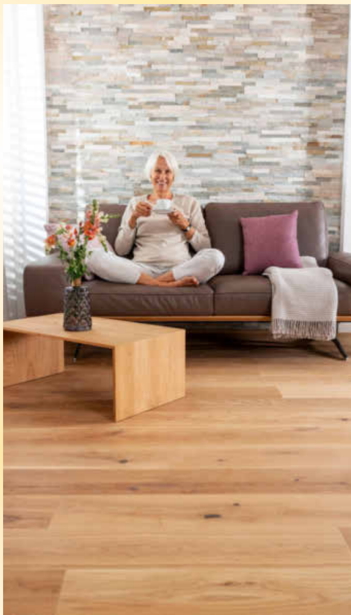
Echte Holzböden bringen ein warmes natürliches Ambiente ins Zuhause. Zugleich handelt es sich um einen besonders nachhaltigen Belag.

Auch Bauherren und Renovierer, die bei der Neugestaltung ihres Holzfußbodens auf einen komplett neuen Look setzen wollen, haben viele Möglichkeiten: Beispielsweise können Parkettprofis durch eine spezielle Bürsttechnik die einzigartige Struktur und den Charakter eines Parkettfußbodens im Handumdrehen neu herausarbeiten. Wer farbliche Akzente auf seinem Boden setzen möchte, hat ebenfalls eine große Auswahl: Aufhellen mit grellen knalligen Farben wie Rot oder Gelb ist ebenso möglich wie das Abdunkeln mit ruhigen dunklen Tönen. Parkettprofis vor Ort beraten dazu gerne.