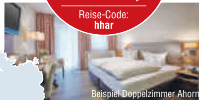
Beispiel Doppelzimmer Ahorn