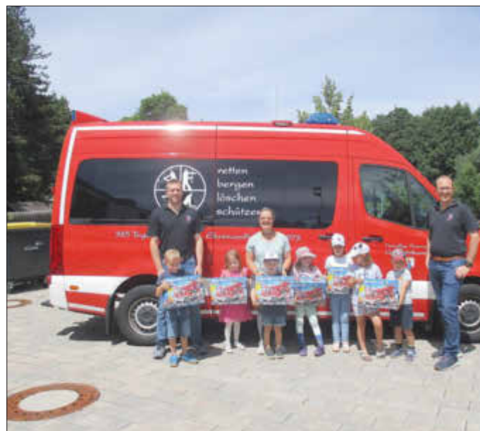
Ihre Kita Pustebume

Wir bedanken uns von ganzen Herzen für diese sehr tolle Spende und freuen uns, wenn uns die Feuerwehr zu unserer nächsten Brandschutzwoche wieder besucht.