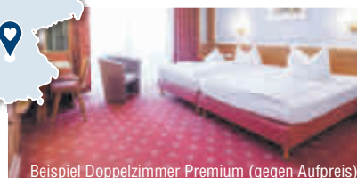
Beispiel Doppelzimmer Premium (gegen Aufpreis)